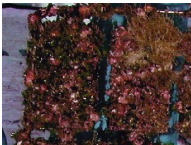
③無地(アルミニウム)