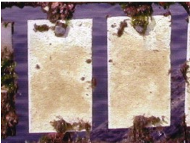
①ファイブヘルツ含有船底防汚塗料 (6%含有)